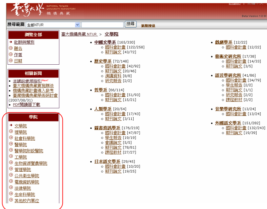
圖 2、切換學院別瀏覽